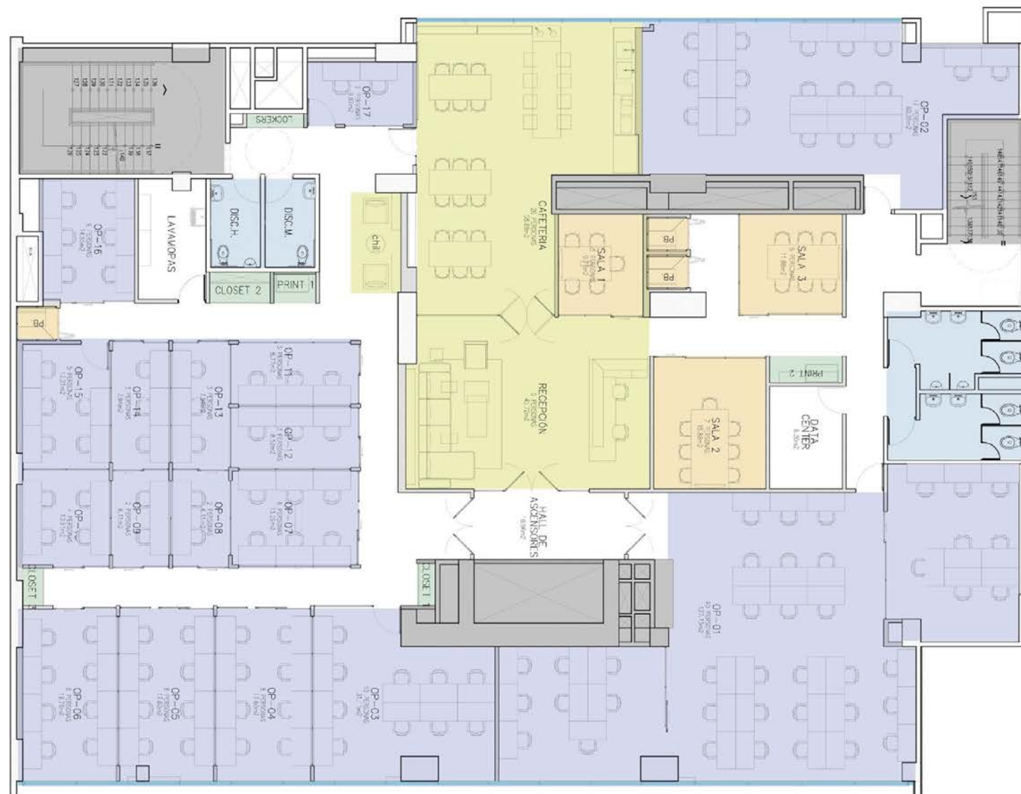
Av. El Polo